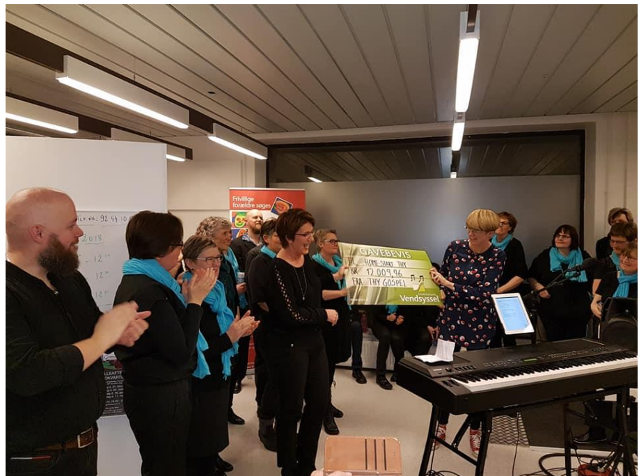
Vi får overrakt 12.000 kr af Thy Gospel

Som altid afholde vi først på året årsmøde lokalt, som var åbent for alle. Vi fejrede vores 10 års jubilæum og Thy Gospel kom og gav koncert, hvorefter de overrakte 12.000 kr, som var overskuddet fra deres gospel-workshop. Et samarbejde de selv havde indbudt til. Der var politikere, ambassadører, frivillige og andre interesserede til stede. En fantastisk aften.