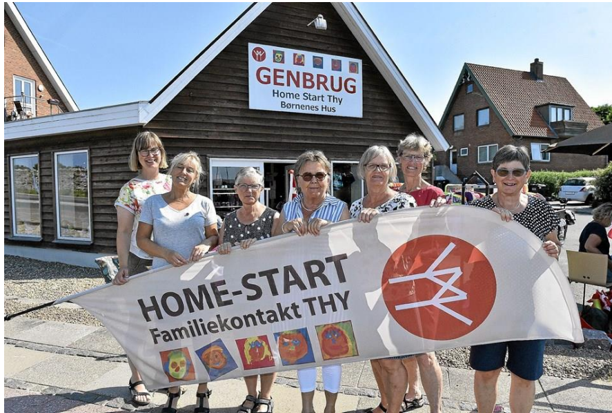
Foto fra fejring af butikkens 5 års fødselsdag

Vi fejrede vores 5 års fødselsdag i juni med fest og flag. En børnehave kom med malede sten til vores facade og der var kaffe og kagemand.