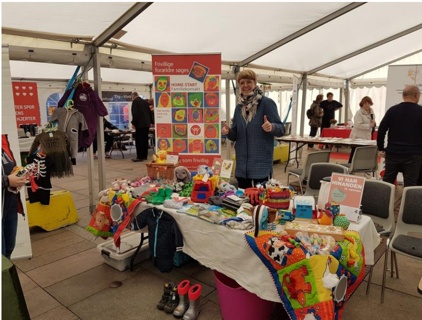
Vores stand på Frivillig Fredag

Vi hjælper trængte og trætte familier igennem den første tid med tvillinger, syge børn, anden sygdom hos familiemedlemmer. Her støtter familievennen familien ved at drage omsorg og lytte, gå tur med de små, lytte efter et sovende barn, lægge tøj sammen således, at familien kan komme til kræfter.